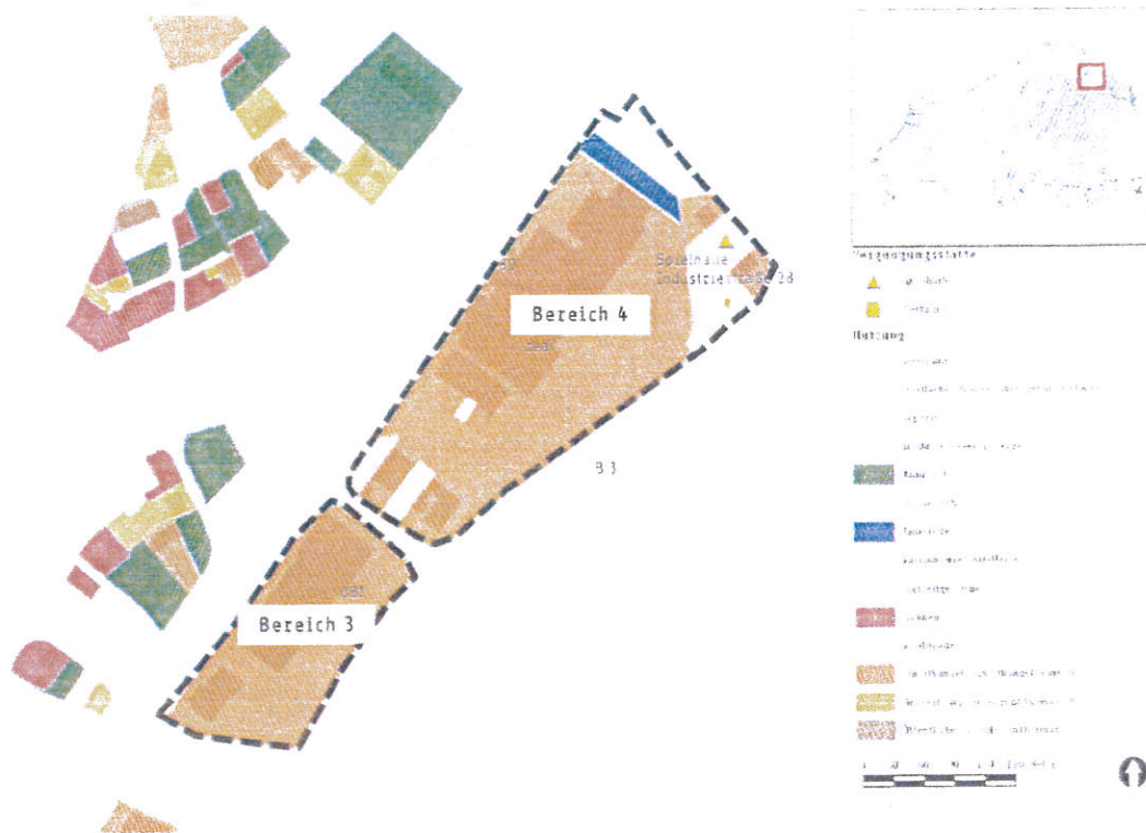
Karte 4: Zulässigkeitsbereiche 3 und 4